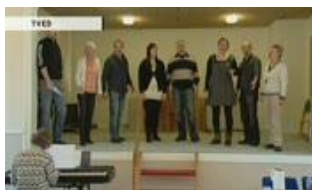
Molsamatørerne er blandt dem, der støttes økonomisk af distriktsrådet