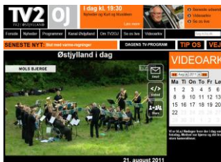
Den årlige koncert i Mols Bjerge fik fin omtale i TV-Østjylland.