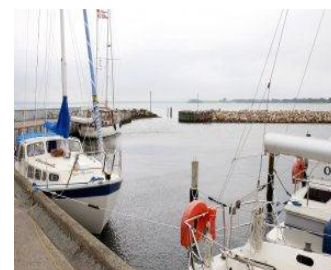
Distriktsrådet følger udviklingen med etablering af pendlerfærgen mellem Samsø over Skødshoved til Århus.