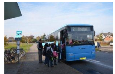
Skolebusser er gratis i nogle områder