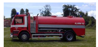
Tankbilen skulle harmoniseres væk fra stationen i Knebel