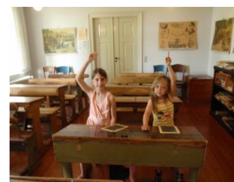
Distriktsrådet har været involveret i bestræbelserne på at bevare museumsudstillingen i præstegården på Helgenæs.