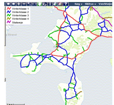
Vintervedligeholdelse reduceres på klasse 2 veje – De fleste veje på Mols / Helgenæs (Blå og grønne)