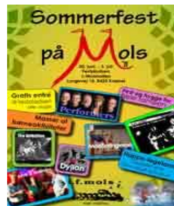
Sommerfesten på Mols, som traditionelt gennem mere end 35 år har været et fællesprojekt for Borgerforening og IF-Mols, er nu delegeret fuldt og helt til sommerfestkomiteen.