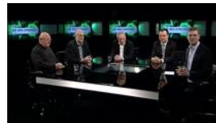
TV2-øst sender i Ud med sproget om Dårlig mobil-forbindelse

Med venlig hilsen Borgerforeningen Mols – Distriktsråd for Mols og Helgenæs Bestyrelsen