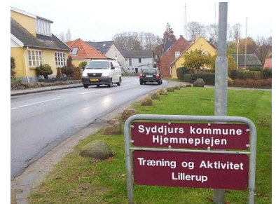
Er det rimeligt at harmonisere Lyngparken til Lillerup

Den målsætning, som i tidernes morgen blev indgået mellem ministeriet og teleselskaberne om en dækningsgrad på 95% er fuldt tilfredsstillende for ministeren . Vi mener, det havde været mere rimeligt med en målsætning på 100%. Sådan er det jo da for de fleste regler i Danmark, at de gælder for alle.