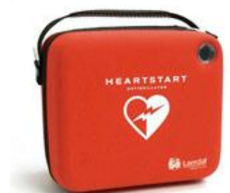
Der er søgt om midler hos Trygfonden til hjertestartere på Skødshoved havn, Knebelbro havn og ved Helgenæs Brugs.