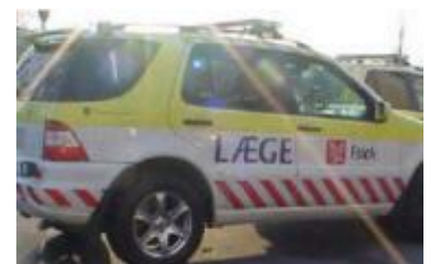
Akutbilen fortsat stationeret i Grenå