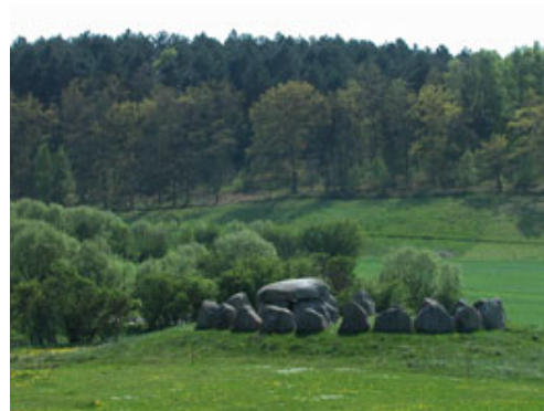
Nordeuropas største runddysse ved Knebel

er Danmarks største runddysse. Det som særligt imponerer, er størrelsen på dyssens sten. Det store sekskantede gravkammer består af 5 store bæresten, hvorpå der ligger en ca. 11,5 tons tung dæksten. Gravkammeret har en østvendt åbning, og af gangen hertil er der bevaret 2 oprejste gangsten udenfor gravkammerets østside. Gravkammeret ligger forskudt mod øst i en omsluttende stencirkel på ca. 13 m i diameter, som indeholder 23 af oprindeligt 24 mere end mandsstore oprejste kampesten