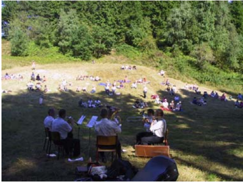
Dynamic Brass band spiller i Mols Bjerge