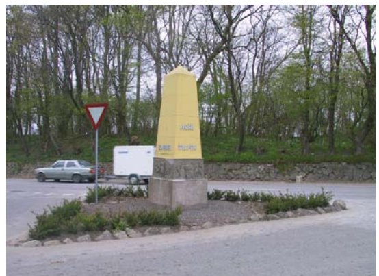
Molbostøtten – en obelisk med relieffer af fire molbohistorier – er placeret ved indkørslen til Knebel. Den lokale købmand sælger en molsvin og bidrager til vedligeholdelse af Molbostøtten ved foden af Nationalpark Mols Bjerge

og en indsamling til formålet har nu resulteret i små 35.000 kr. så nu er restaureringen en realitet. Den lokale købmand sælger en molsvin, hvor etiketten har lokalt motiv og