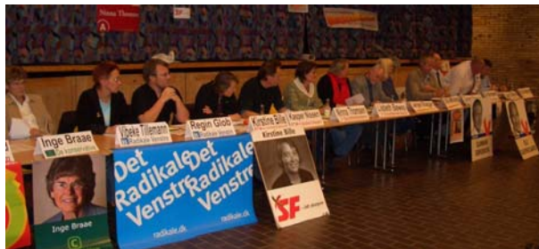
Borgerforeningens store vælgermøde i skolens festsal

En del af Knebel på 13 parceller har døbt deres område ”De 13 Rigtige”. Navnet stammer tilbage fra en sommerfest med fodboldhold på vejniveau. Holdene skulle navngives. I det område mødes beboerne stadigvæk på skift hos hinanden én lørdag om måneden kl. 10.30 medbringende egen øl/vand og alle skal forlade selskabet medbringende sin tomme flaske kl. 12.00. Den mellemliggende tid bruges på kvarterets sociale, kulturelle og politiske behov, og lignende fællesskaber findes andre steder i Knebel.