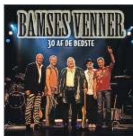
Store navne som Bamses venner har gjort sommerfesten i Knebel til et hit gennem 34 år

Sommerfesten i Knebel tilrettelægges af de to store foreninger, Borgerforeningen og Idrætsforeningen gennem en sommerfestkomité. Sommerfesten trækker rigtig mange mennesker over flere dage i den traditionelle, store festuge på Mols og er ligesom den begivenhed, hvor bortdragne molboer for en stund vender tilbage og hilser på hinanden. Mange store navne har fyldt det store telt på festpladsen mellem skole og hal med glade mennesker, fastboende som sommergæster med base i sommerhuse og på campingpladser, der gladelig synger med på Molssangen.