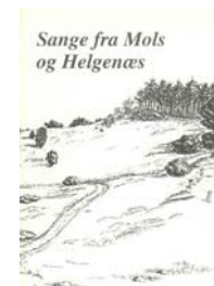
Borgerforeningen har samlet sange gennem tiderne. Se mere http://www.borgerforeningen-mols.dk/molssange.htm