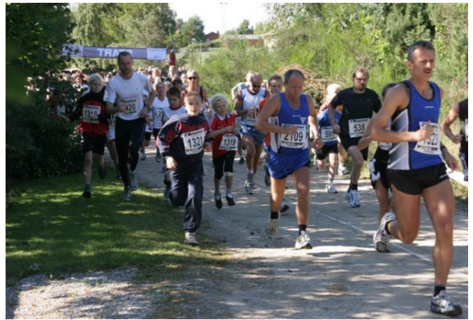
Molsløbet - Danmarks smukkeste motionsløb 3 ruter i Mols Bjerge: 6 km - 11,4 km - ½ maraton