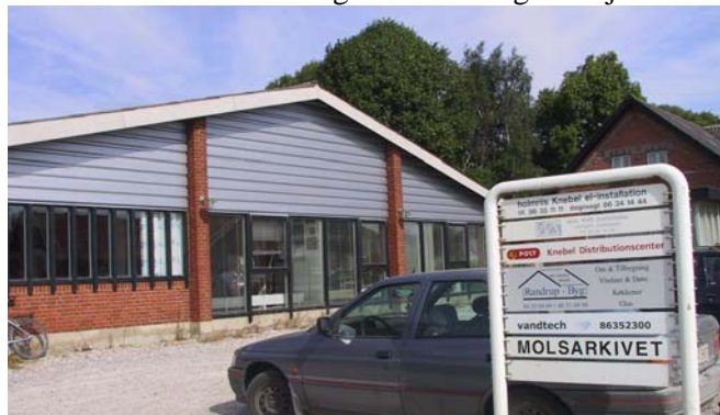
Nye aktiviteter i nedlagt møbelfabrik – Her bl.a. Molsarkivet

Som eksempel på genanvendelse af ældre huse og bygninger kan nævnes Lokalarkivet og Menighedshuset, der nu har til huse i nedlagte industri- og landejendomme.