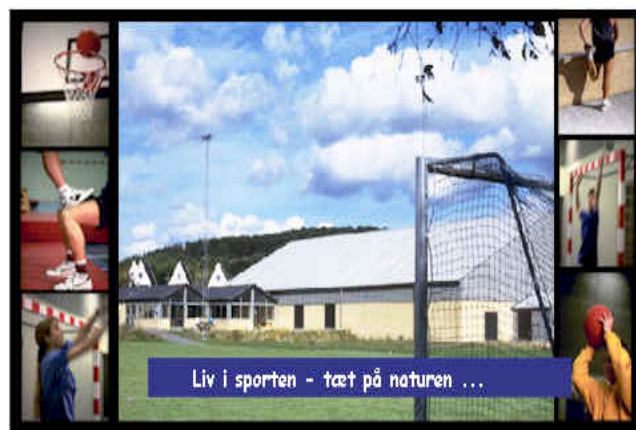
Molshallen – et blandt flere væresteder ud over skole, aktivitetscenter i Lyngparken, menighedshuset, lokalarkivet og brandstationens lokaler.

Molsskolen er måske Danmarks smukkeste beliggende skole, nær bakker, skov og strand, og som i hvert fald er berømt i fagblade – ikke alene for sit udseende, sin byggestil og placering i landskabet, men i høj grad