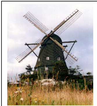
Møllen er den eneste tilbageværende mølle i Syddjurs. Borgerforeningen arbejder sammen med ejerne, Kulturarvstyrelsen og LAG-Djursland om bevarelsen af denne kulturarv

Paradoksalt nok er trenden i dag, at myndighederne afsætter midler gennem EU, Stat, Region og Kommune til at støtte livet på landet, men det er de samme myndigheder, som beslutter budgetmæssige reduktioner på rigtig mange af de vitale områder for at opretholde livet på landet.