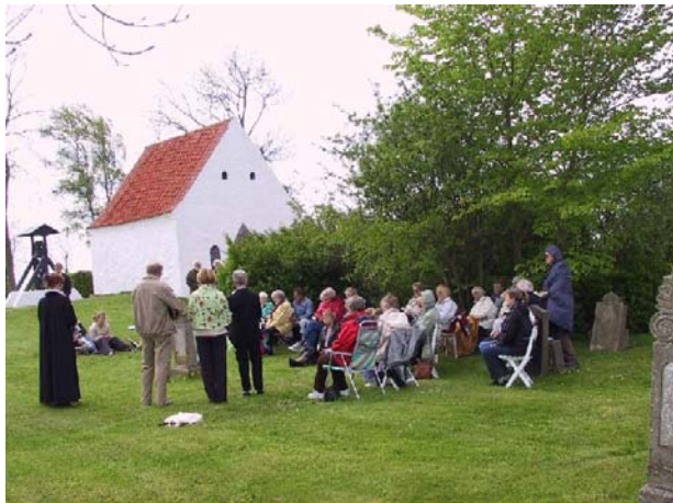
Også udendørsgudstjenester på Rolsø Kapel hører til de faste og velbesøgte arrangementer i årets løb

Se mere www.borgerforeningen-mols.dk/billedside.htm