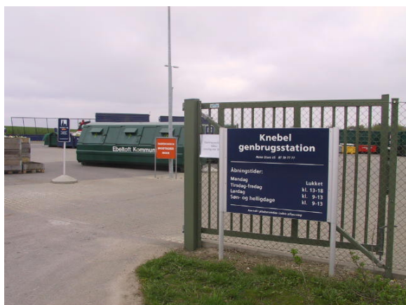
Genbrugsstationen bidrager til bevidstgørelse om forbrug og smid-væk-kulturen

Der er rigtig mange institutioner i Knebel. Hele to børnehaver, hvoraf den ene – en skovbørnehave – flytter rundt i Mols Bjerge på fem forskellige lokaliteter året rundt. Byen rummer også en genbrugsstation for hele Mols. Her er der ikke alene styr på affaldet; men derfra kan man hente såvel kompostjord som kompostorm til vedligeholdelse af de mange havekomposteringsbeholdere.