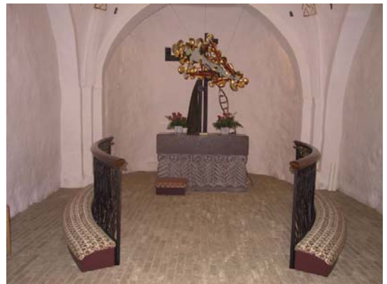
Alterpartiet i Knebel kirke