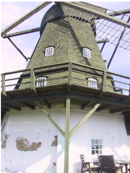
Igangværende berøpning og kalkning af murværket