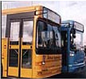
Kollektiv trafik er under pres i både region og kommune