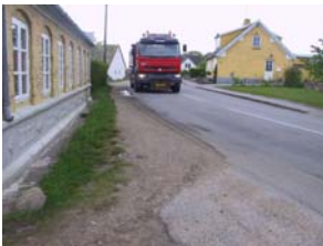
De svage trafikanter har det svært

På mange måder har det som konsekvens, at der er skabt en vision, som - har det vist sig - slet ikke kan indfries. Besparelsesrunder har reduceret mange kommunale ydelser. På flere felter har det været en blandet fornøjelse at ofre mange ressourcer på høringsfaser, for så efterfølgende at opdage, at økonomien slet ikke rækker til visionerne endsige intentionerne, kompromiserne eller blot de helt banale forslag. Glædeligt er det imidlertid, at på områder, hvor der ikke umiddelbart er økonomiske konsekvenser, er der også blevet lyttet.