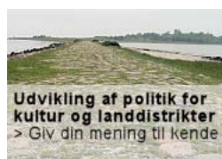
Medlemmer har deltaget i alle de for området relevante møder

Eksempelvis Regionens akutplan herunder udrykningslæge og placering af akutbilen i Grenå, så responstiden fortsat forbliver langt højere end de nys indgåede aftaler på Christiansborg foreskriver og på trods af evalueringsrapporten, der peger på en placering i Kolind – midt på Djursland! Men også den tiltagende brug af mobiltelefoni i den kommunale service kan give anledning til debat, hvis myndighederne ikke har garanti for at teknikken virker overalt. Det hjælper jo ikke at lægeambulancen kan stå i forbindelse med det modtagende sygehus, hvis forbindelsen til sygehuset ustandselig falder ud under transporten.