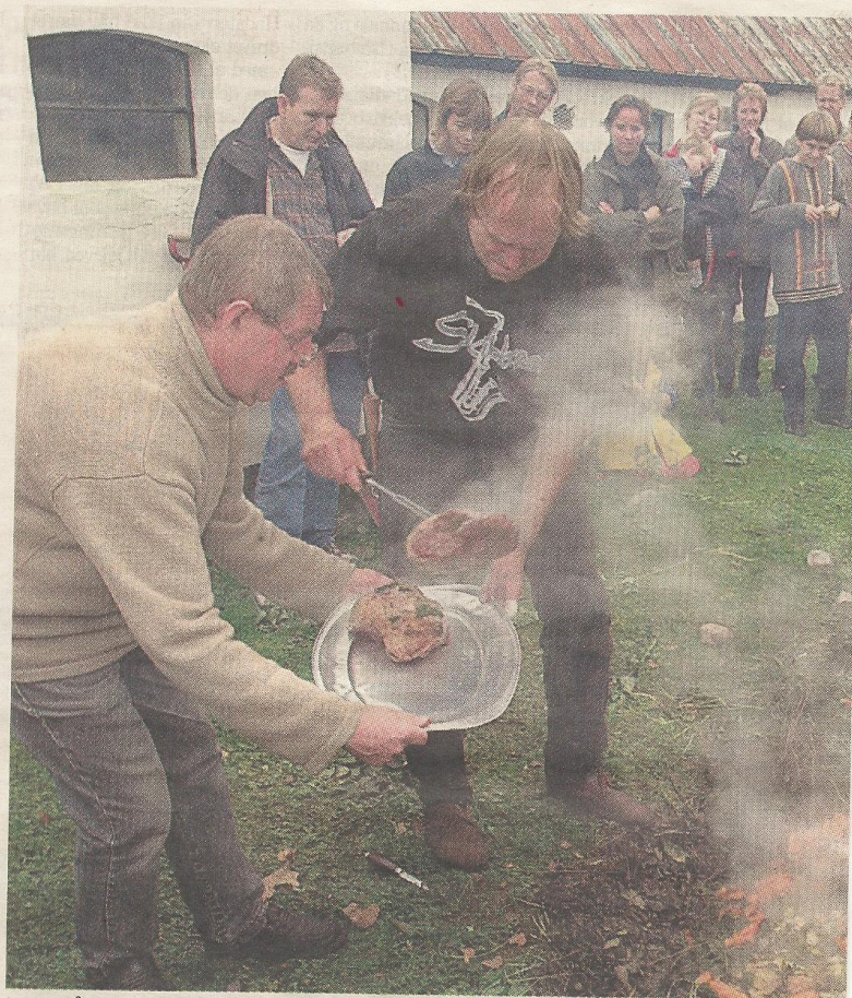
I mange år har lokale museumsfolk skabt et utal af udendørs aktiviteter i Helgenæs Præstegård. Nu lukker museet, men i kulissen samler frivillige kræfter.

Modstanden har dog ikke flyttet ledelsen af den museumsfusion, der bliver en realitet ved nytårsskiftet. Derfor har Borgerforeningen Mols