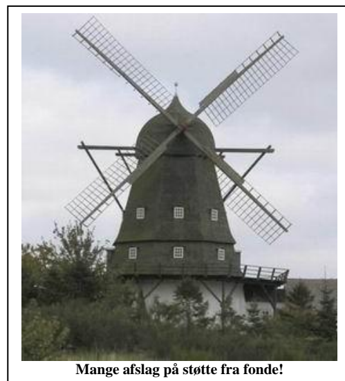
Mange afslag på støtte fra fonde!

Syddjurs kommune har inviteret distriktrådene til at kommentere trafikikkerhedsplanen. Bestyrelsen fastholder den gældende plan suppleret med fartdæmpning flere steder. Vi har stadigvæk fokus på bevarelse af Vistoft Mølle og fremsendte en ansøgning til RealDania under kampagnen Stedet tæller! Omkring budgettid skal vi være særlig påpasselige. Embedsmænd har til opgave at forelægge forskellige forslag, som politikerne så kan forholde sig til, forkaste, godkende eller supplere. Sådan er det hvert år. I 2013 kataloget pegede embedsfolket på, at man faktisk har et økonomisk og pædagogisk bæredygtigt skolevæsen. Men hvis der skal spares yderligere, var et af forslagene at flytte overbygningen på Molsskolen til Rønde. Borgerforeningen udviste rettidig omhu og fremsendte kommentar hertil inden budgetforhandlingerne tog fart. Den kommentar udløste megen anerkendelse fra både skole og skolebestyrelse, men burde være helt overflødig i betragtning af de tidligere bemærkninger om områdets attraktive karakter. Set i lyset heraf er det helt uforståeligt, at en gruppe mennesker på 20 familier har så stort besvær med at etablere et bofælleskab i et område, som i kommuneplanen er udlagt til kommende boligområde. Borgerforeningen støtter projektet fuldt ud.