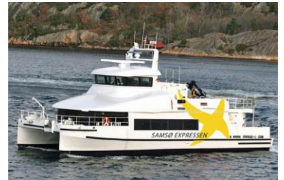
Færgeforbindelsen mellem Samsø Århus og Skødshoved udskutt

Det betyder slet ikke, at samfundet går fuldstændig i stå. Det betyder bare, at vi bliver lidt mere bevidste om de valg, vi træffer. Efter mere end syv fede år er det dog ikke til skade at satse på syv - om ikke magre - så dog mådeholdne år.