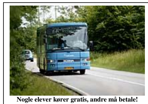
Nogle elever kører gratis, andre må betale!

Konsekvens er måske også et fraværende begreb, når det gælder skolebusser. Kommunetilsynet vil vurdere, om det er lovligt, at Syddjurs kommune flere steder lader skoleelever køre gratis, medens elever langs ruter til bl.a. Molsskolen skal betale for at komme i skole. Tilsynet har udbedt sig en forklaring. Borgerforeningen har tidligere skrevet til kommunen om sagen og stillet sig tvivlende over for , om kommunen tilsidesatte et gældende princip om lighed, og overhovedet havde nogen besparelse ud af beslutningen.