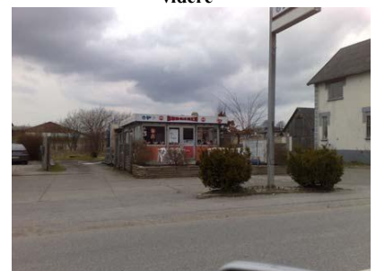
Lokalplan 371 for Knebel. Med nedrivning af burgeren samt "Smedens hus", som nu er helt væk!