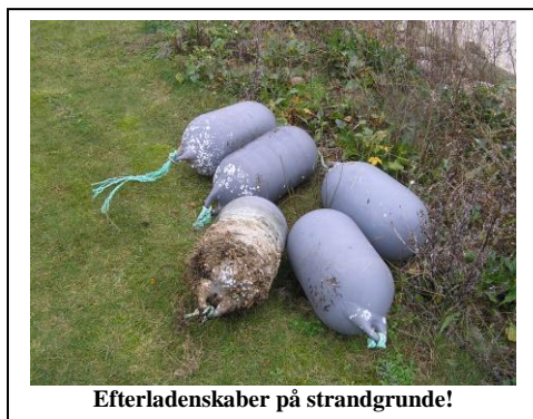
Efterladenskaber på strandgrunde!

Muligheden for at etablere fjernvarme har tidligere været vurderet i Knebel, men uden realisering. Kommunen lægger i sin varmeplan op til, at der findes en samarbejdspartner, der ønsker at lave en vurdering af mulighederne for at etablere en eller anden form for kollektiv forsyning baseret på CO2 neutrale brændsler. Der ønskes også en vurdering af en kobling til Tved og Vrinners. Plan & Energi APS har taget tråden op og forelagt et oplæg for kommunen og Borgerforeningen. Bestyrelsen har haft to møder med Plan & Energi. Der ventes nu på at kommunen indkalder til off. møde om sagen!