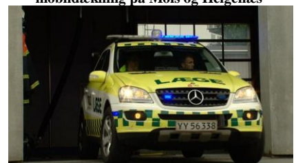
Regionsrådet besluttede 30. maj at akutlægebilen placeres i Grenaa "indtil videre"