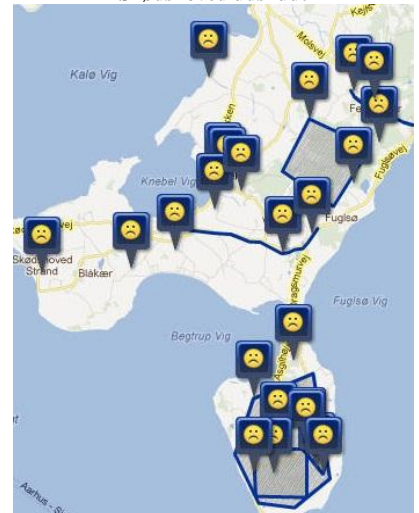
Indberettede klager over manglende mobildækning på Mols og Helgenæs