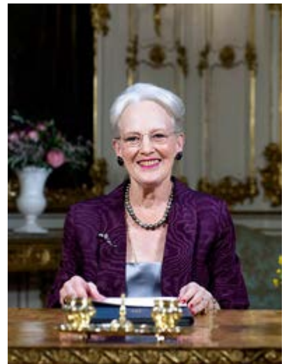
Dronningens nødvendige opsange prægede regentens nytårstale.

Når middelmådigheden råder, og folk ikke gør sig umage, er der tale om elendighed, mener håndboldlandsholdets tidligere træner Ulrik Wilbek, der i en bog slår et slag for at udrette noget alene og sammen med andre.