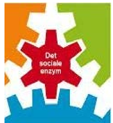
Er du det lille enzym, der får tingene til at virke?

Bestyrelsen for Borgerforeningen Mols aflægger