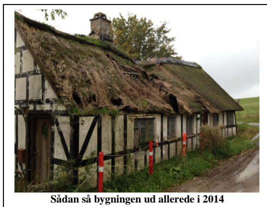
Sådan så bygningen ud allerede i 2014

Syddjurs Kommune har i marts 2017 foranstaltet sikringsarbejde, da skorstenen var i fare for at styrte ud på en privat fællesvej. Sikringsarbejdet har betydet, at bygningen nu fremstår nærmest uden tag og bygningen er skæmmende for omgivelserne. Den er synlig set fra Bygaden for både lokale og turister. Der er derfor stor bevågenhed lokalt og også stor frustration over, at der ingen ting er sket siden sagen tog sin begyndelse i 2011. Ejendommen har i adskillige år været aldeles forsømt. Dette har medført at mange bygningsdele (stråtag, afdækning, tagplader m.m.) ved blæsevej er endt uden for matriklen. Ikke just fremmede for lokale bestræbelser på at tiltrække nye beboere til området.