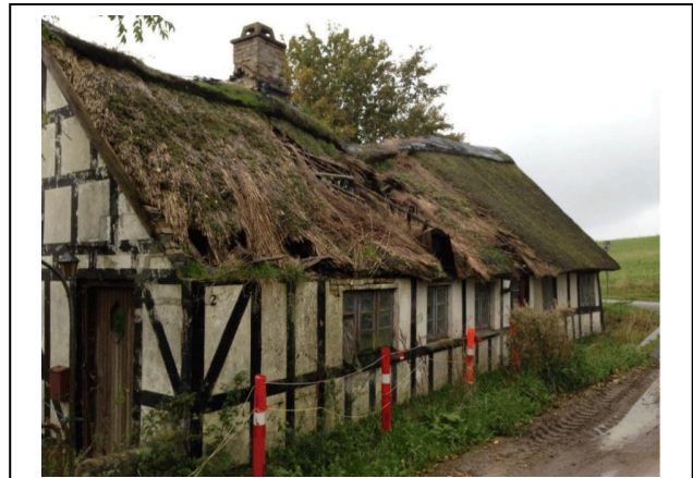
Sådan så bygningen ud allerede i 2014