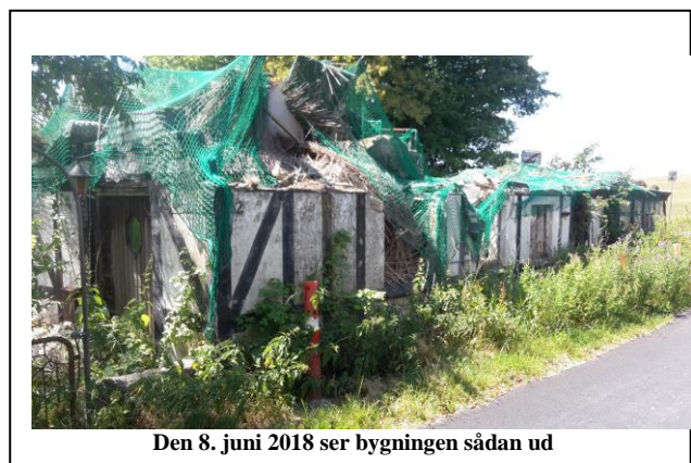
Den 8. juni 2018 ser bygningen sådan ud