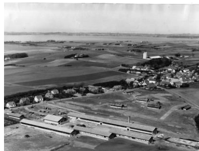
Bygningen af Molsskolen ændrede mulighederne på Mols og Helgenæs!

De gevaldige gravhøje viser, at landet også var fint befolket i bronzealderen. Mols og Helgenæs er velkendt som ferieland med mange sommerhuse, feriegæster og en stor turiststrøm.