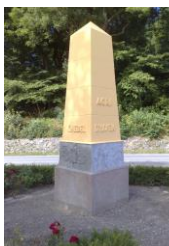
Molbostøtten, et mindesmærke over molbohistorierne

De kendte molbohistorier sætter vi stor pris på - velvidende, at de næppe er så "sande" som de senere lige så kendte Aarhus historier! Hvor længe der har levet mennesker på Mols og Helgenæs er svært at sige. Men de mange stendysse vidner om, at området var godt befolket i Stenalderen.