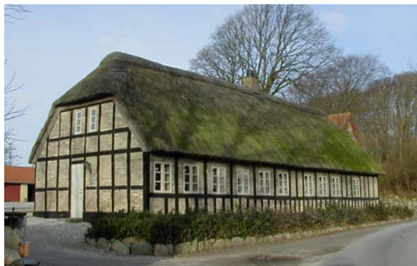
Menighedshuset i Knebel – et meget anvendt værested

På samme vis fungerer den gamle skole som galleri, og der er nu frisørsalon i en nedlagt Unibank, medens apotek og sparekasse finder sammen i fælles lokaler på hovedgaden. Her har Danske Bank i forvejen lokalfællesskab med det nyetablerede ”Ønskefonden”. Flere ældre landbrugsejendomme er indrettet med boliger eller ferielejligheder. Ligesom et gammelt nedbrændt hotel er genopstået som feriecentret Mols Bjerge. Tinghulen er ikke alene navnet på et berømt død-is-hul i Mols Bjerge, men også navnet på en restaurant i byen. Endog har et smedeværksted set dagens lys i en tom landbrugsejendom.