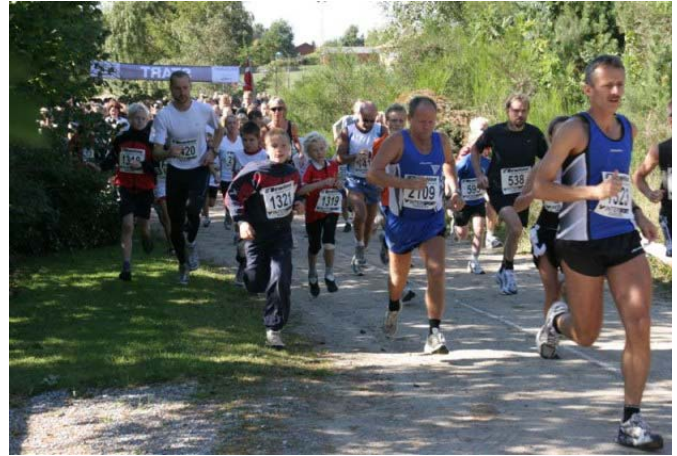
Molsløbet - Danmarks smukkeste motionsløb 3 ruter i Mols Bjerge: 6 km - 11,4 km - ½ maraton