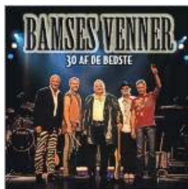
Store navne som Bamses venner har gjort sommerfesten i Knebel til et hit gennem 33 år

Sommerfesten i Knebel tilrettelægges af de to store foreninger, Borgerforeningen og Idrætsforeningen gennem en sommerfestkomité. Sommerfesten trækker rigtig mange mennesker over flere dage i den traditionelle, store festuge på Mols og er ligesom den begivenhed, hvor bortdragne molboer for en stund vender tilbage og hilser på hinanden. Mange store navne har fyldt det store telt på festpladsen mellem skole og hal med glade mennesker, fastboende som sommergæster med base i sommerhuse og på campingpladser, der gladelig synger med på Molssangen.