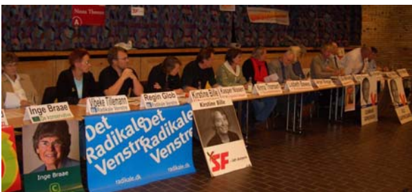
Borgerforeningens store vælgermøde i skolens festsal

En del af Knebel på 13 parceller har døbt deres område ” De 13 Rigtige ”. Navnet stammer tilbage fra en sommerfest med fodboldhold på vejniveau. Holdene skulle navngives. I det område mødes beboerne stadigvæk på skift hos hinanden én lørdag om måneden kl. 10.30 medbringende egen øl/vand og alle skal forlade selskabet medbringende sin tomme flaske kl. 12.00. Den mellemliggende tid bruges på kvarterets sociale, kulturelle og politiske behov og lignende fællesskaber findes evt. andre steder i Knebel.