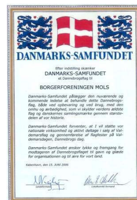
Danmarkssamfundets påskønnelse af foreningens arbejde

http://www.borgerforeningen-mols.dk/flagalle.htm