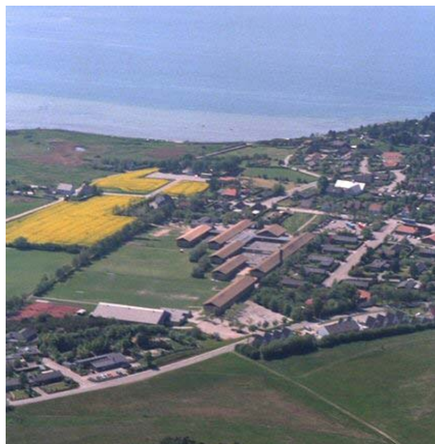
Luftfoto af Knebel med Molsskolen i centrum