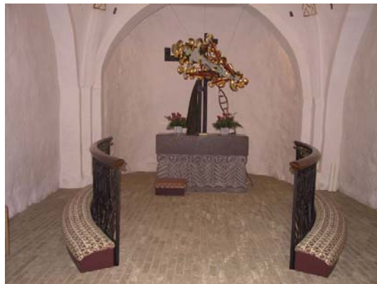
Alterpartiet i Knebel kirke