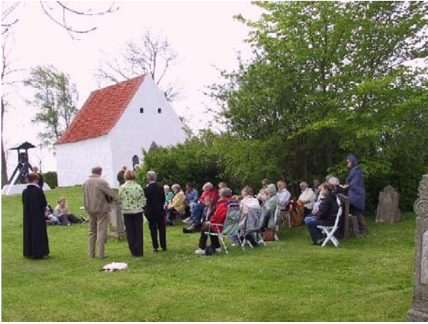
Også udendørsgudstjenester på Rolsø Kapel hører til de faste og velbesøgte arrangementer i årets løb