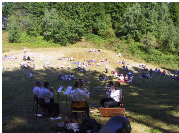
Dynamic Brass band spiller i Mols Bjerge