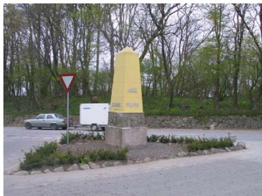
Molbostøtten – en obelisk med relieffer af fire molbohistorier – er placeret ved indkørslen til Knebel. Den lokale købmand sælger en molsvin og bidrager til vedligeholdelse af Molbostøtten ved foden af den kommende Nationalpark Mols Bjerge

og en indsamling til formålet har nu resulteret i små 35.000 kr. så nu er restaureringen sat i gang. Den lokale købmand sælger en molsvin, hvor etiketten har billede af Støtten og SPAR i Knebel bidrager således til vedligeholdelse af Molbostøtten ved foden af den kommende Nationalpark Mols Bjerge. Se mere om Molbostøtten og reliefferne på netadressen: http://www.borgerforeningen-mols.dk/molbostotten.htm