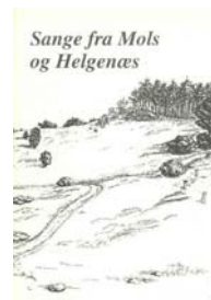
Borgerforeningen har samlet sange gennem tiderne. Se mere http://www.borgerforeningen-mols.dk/molssange.htm