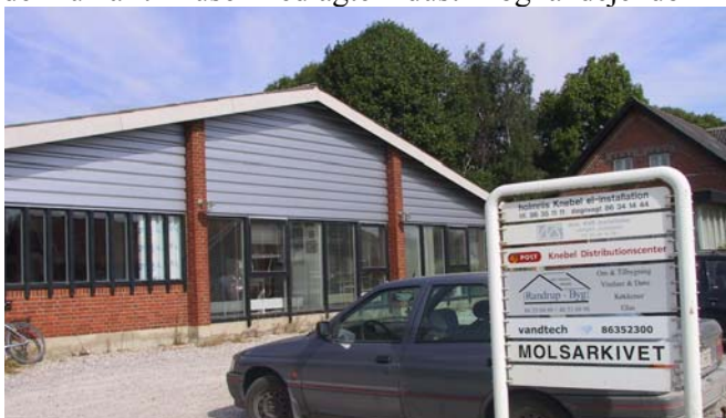
Nye aktiviteter i nedlagt møbelfabrik – Her bl.a. Molsarkivet

Som eksempel på genanvendelse af ældre huse og bygninger kan nævnes Lokalarkivet og Menighedshuset, der nu har til huse i nedlagte industri- og landejendomme.