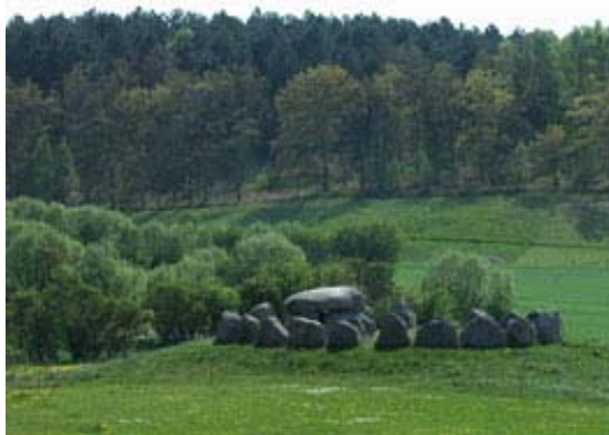
Nordeuropas største runddysse ved Knebel

er Danmarks største runddysse. Det som særligt imponerer, er størrelsen på dyssens sten. Det store sekskantede gravkammer består af 5 store bæresten, hvorpå der ligger en ca. 11,5 tons tung dæksten. Gravkammeret har en østvendt åbning, og af gangen hertil er der bevaret 2 oprejste gangsten udenfor gravkammerets østside. Gravkammeret ligger forskudt mod øst i en omsluttende stencirkel på ca. 13 m i diameter, som indeholder 23 af oprindeligt 24 mere end mandsstore oprejste kampesten