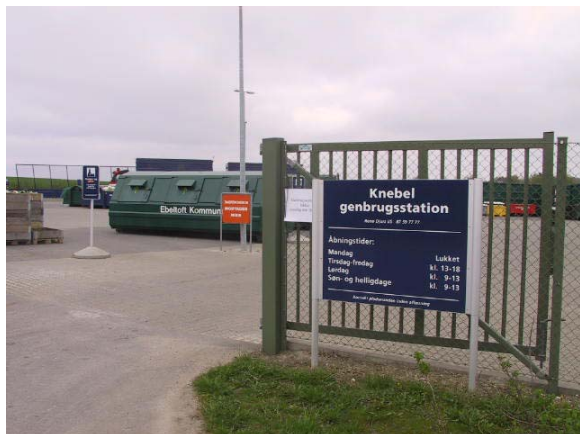
Genbrugsstationen bidrager til bevidstgørelse om forbrug og smid-væk-kulturen

Der er rigtig mange institutioner i Knebel. Hele to børnehaver, hvoraf den ene – en skovbørnehave – flytter rundt i Mols Bjerge på fem forskellige lokaliteter året rundt. Byen rummer også en genbrugsstation for hele Mols. Her er der ikke alene styr på affaldet; men derfra kan man hente såvel kompostjord som kompostorm til vedligeholdelse af de mange havekomposteringsbeholdere.