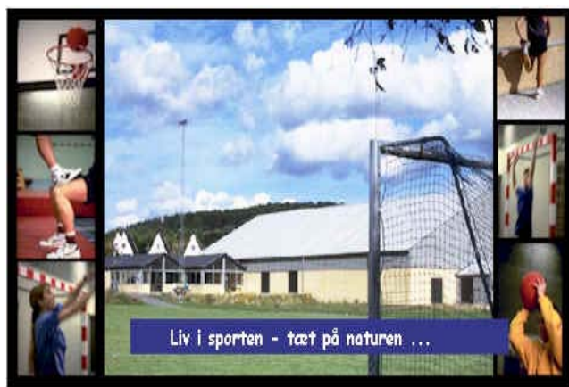
Molshallen – et blandt flere væresteder ud over skole, aktivitetscenter i Lyngparken, menighedshuset, lokalarkivet og brandstationens lokaler.

Molsskolen er måske Danmarks smukkeste beliggende skole, nær bakker, skov og strand, og som i hvert fald er berømmet i fagblade – ikke alene for sit udseende, sin byggestil og placering i landskabet, men i høj grad også for sit daglige virke. Man kan roligt sige, at Molsskolen er fremme i skoene både pædagogisk og undervisningsmæssigt. Den intelligente tavle gør det lettere for lærerne at forberede undervisningen derhjemme, det kan de gøre på deres computer, og så sætte computeren til den intelligente tavle, når de skal undervise. Den intelligente tavle bruges som touchscreen. Det vil sige, at man kan bruge sin finger som mus og trykke sig rundt ved hjælp af fingeren. Molsskolen er også et attraktivt værested.