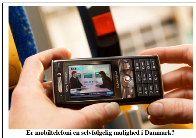
Er mobiltelefoni en selvfølgelig mulighed i Danmark?

Når bogbussen hver uge kommer til Mols og Helgenæs, skal den holde nogle ganske bestemte steder på ruten. Bogbussen er udstyret med et kommunikationssystem, hvor bibliotekaren via mobilnettet kan registrere udlån af bøger i bibliotekets database. Hvis bussen ikke holder sig inden for ganske få meter i forhold til de bestemte holdsteder, virker systemet slet ikke tilfredsstillende – om overhovedet!