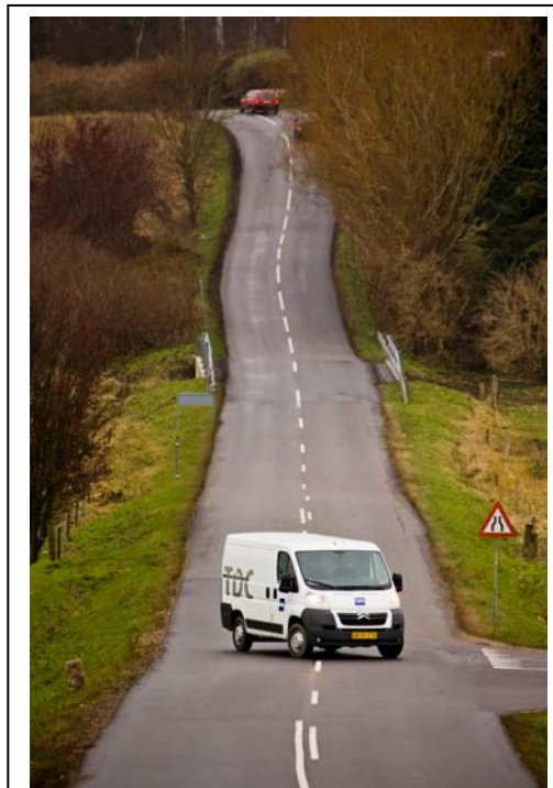
TDC har måske selv prøvet at være uden mobilkontakt sine steder – siden man holder her?

På samme sæt har det vist sig, at antennen ved Agri, der en gang har stået frit, nu er omgivet af træer hele vejen rundt og trækronerne vejrer flere meter over antennerne med dæmpning af radiobølgerne og reduceret dækningsområde til følge.