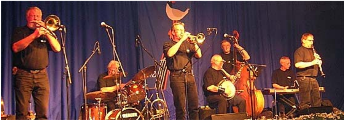
Arosia i Ridehuset

Borgerforeningen MOLS gentager succesen fra sidste år. Vi vil gøre det til en fast tradition at gennemføre et arrangement i Mols Bjerge på arealet "Svends Kælder" med den amfiteater-lignende stemning over sig. Stedet hvor "Den Klassiske" startede sine koncerter med fornemme kunstnere, som kunne tiltrække gæster fra nær og fjern.