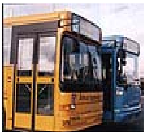
Kollektiv trafik er under pres i både region og kommune