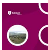
Forslag til planstrategi

Borgerforeningen har tradition for at invitere til møde med vore valgte politikere en gang om året. Det plejer at være en god debataften. Mange aktuelle emner bliver berørt i aftenens løb og således bliver det også torsdag den 4. december 2008 kl. 19.30 i menighedshuset i Knebel, hvor alle lister i Syddjurs kommune sammen med de to regionsrepræsentanter fra Djursland er inviteret til debattmøde. Der er tilsagn fra næsten alle og panelet får følgende sammensætning: