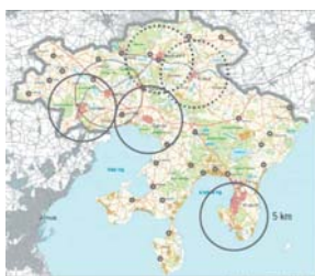
Måbøkker og forslag til biblioteksudviklinger i Sydøstsjælland

Når der uddannes for få læger, når politireformen ikke fungerer, når postvæsenet lader prisen stige samtidig med at servicen forringes, så mærkes ændringerne først og fremmest i de marginaliserede områder som f.eks. Mols og Helgenæs. Marginaliserede områder må i særlig grad gøre en indsats for at bevare ”Det gode liv”. Det er ikke nok at være udråbt til Nationalpark! Så velkommen til dialog med politikerne!