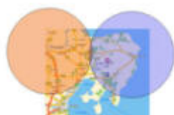
Evaluering af lægebil

Borgerforeningen har tradition for at invitere til møde med vore valgte politikere en gang om året. Det plejer at være en god debataften. Mange aktuelle emner bliver berørt i aftenens løb og således bliver det også torsdag den 4. december 2008 kl. 19.30 i menighedshuset i Knebel, hvor alle lister i Syddjurs kommune sammen med de to regionsrepræsentanter fra Djursland er inviteret til debattmøde. Der er tilsagn fra næsten alle og panelet får følgende sammensætning: