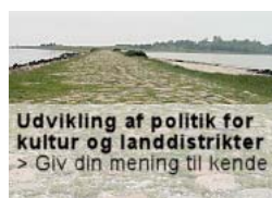
Medlemmer har deltaget i alle de for området relevante møder

Eksempelvis Regionens akutplan herunder udrykningslæge og placering af akutbilen i Grenå, så responstiden fortsat forbliver langt højere end de nys indgåede aftaler på Christiansborg foreskriver og på trods af evalueringsrapporten, der peger på en placering i Kolind – midt på Djursland! Men også den tiltagende brug af mobiltelefoni i den kommunale service kan give anledning til debat, hvis myndighederne ikke har garanti for at teknikken virker overalt. Det hjælper jo ikke at lægeambulancen kan stå i forbindelse med det modtagende sygehus, hvis forbindelsen til sygehuset ustandselig falder ud under transporten.