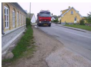
De svage trafikanter har det svært

På mange måder har det som konsekvens, at der er skabt en vision, som - har det vist sig - slet ikke kan indfries. Besparelsesrunder har reduceret mange kommunale ydelser. På flere felter har det været en blandet fornøjelse at ofre mange ressourcer på høringsfaser, for så efterfølgende at opdage, at økonomien slet ikke rækker til visionerne endsige intentionerne, kompromiserne eller blot de helt banale forslag. Glædeligt er det imidlertid, at på områder, hvor der ikke umiddelbart er økonomiske konsekvenser, er der også blevet lyttet.