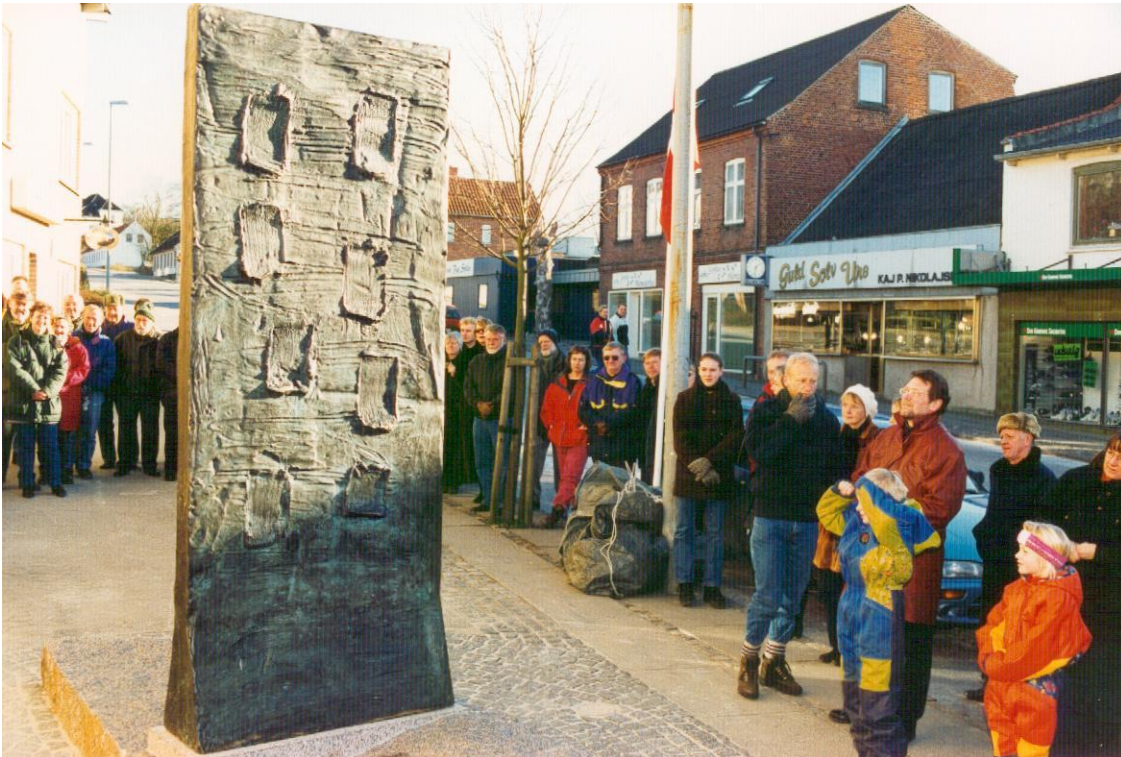
Günther Förgs stele afsløres på pladsen foran Trangbæks boghandel en kold januar dag 1998. En del tilsvarende steler af Günther Förg kan ses på Louisiana i Nordsjælland. Stelen var Røndes første større kunstværk – og begyndelsen til Åben Vand.