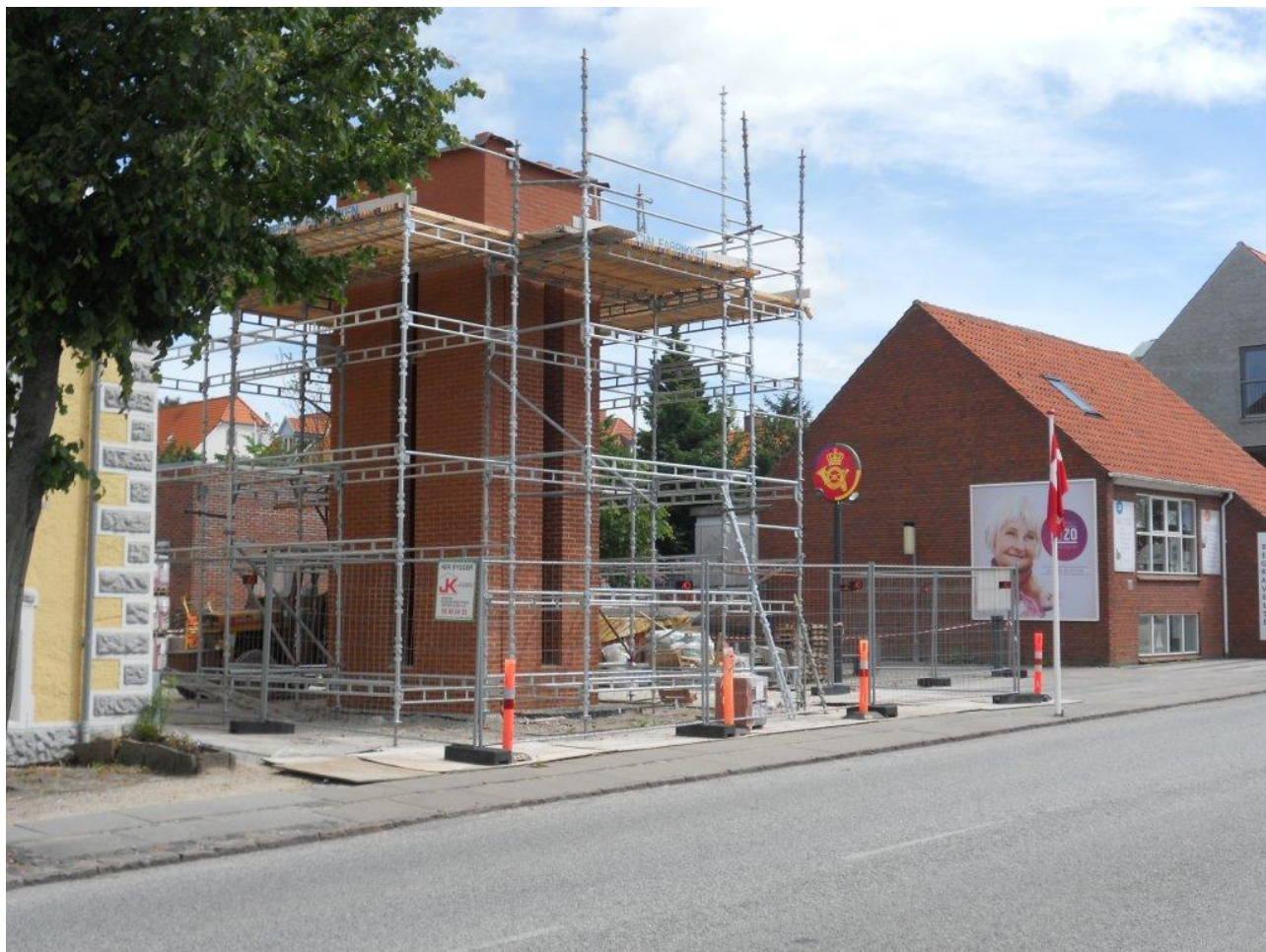
Det første tårn under opførelse på Kaløtorvet, juni 2012

De fleste er klar over, at tårnene er tegnet af den internationalt kendte danske kunstner Per Kirkeby og at de har noget med "Åben Vand" at gøre. Men hvad er det lige, baggrunden for det hele er?