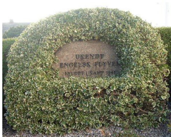
Gravstedet på Dråby kirkegård.

Det andet gravsted (foto til højre) over en uidentificeret flyver er på Dråby kirkegård, lige syd for kirken. Liget af flyveren drev i land på Boeslum Strand 29. juli 1945, og flyveren blev begravet 1. august uden at