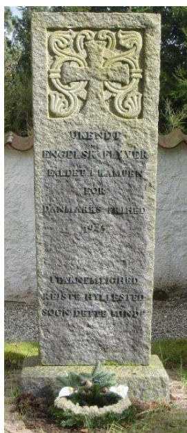
Gravstedet på Hyllested ny kirkegård.

Der findes tre gravsteder for allierede flyvere på Syddjurs, to af dem med uidentificerede flyvere i hhv. Hyllested og Dråby, en med en identificeret på Tved kirkegård.