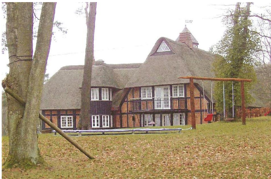
Nørrehald, Fischers egen bolig.

Egil Fischers gave overgik ved kommunalreformen i 1970 til den nye Ebeltoft Kommune og efter seneste kommunalreform i 2007 til Syddjurs Kommune. Hele området er i dag en del af Nationalpark Mols Bjerge.