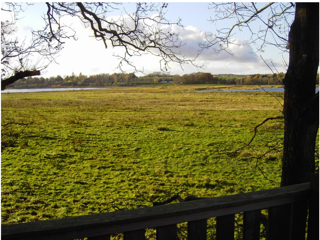
Udsigt fra fugletårnet i Hestehaveskovens udkant over Følle Bund. Til venstre Følle Vig og midt i billedet Følle Strandgård. Til højre en del af den oversvømmede strandeng. Foto VFH nov. 2010.

Følle Bund er en strandeng, dannet ved Knubbro Bæks udløb i Følle Vig, som en slags overgangsområde mellem landet og havet. Den blev inddæmmet og drænet i 1930'erne og fungerede derefter frem til 2004 som et græsningsområde for Kaløs ungvæg – eller som udlejet til andre lokale landmænd til samme formål. Tre jordlodder i området blev efter Kaløs konfiskation i 1945 udstykket til lokale husmænd og blev foruden til græsning benyttet til jagt, idet vildtet fra de nærliggende Kalø-skove færdedes gennem den oprindelige strandeng.