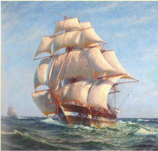
Fregatten i sine velmagtsdage, flådens hurtigste

Fregatten ”Jylland” udgik af flåden i 1908 for at blive hugget op. Men private indsamlinger forhindrede ophugningen, og skibet fandt i de følgende år andre anvendelser, bl.a. var det i mange år logiskib for skolebørn fra provinsen i Københavns havn.