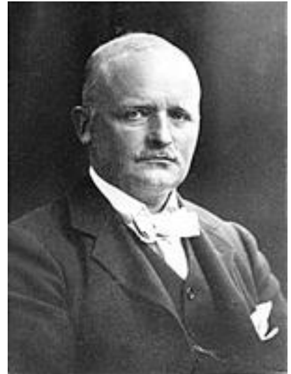
Hack Kampmann (1856-1920)

Den kendte arkitekt og kgl. bygningsinspektør Hack Kampmann har stået for opførelsen af usædvanlig mange bygninger på Djursland. De fleste af dem er opført i de to første årtier af 1900-tallet. I den ene ende af perioden finder vi Kalø Jagtslot, der er opført i 1899. I den anden ende finder vi den gamle toldkammerbygning i Ebeltoft, der nu er glasmuseum, og som blev opført i 1921 efter Kampmanns tegninger (Kampmann døde året før – han var i øvrigt præstesøn fra Ebeltoft). I perioden mellem de to ovenfor nævnte bygninger stod Hack Kampmann som kgl. bygningsinspektør for opførelsen af arresten, tinghuset, herredskontoret og herredsfogedboligen i Hornslet i 1910 (indviet 1911). Det er disse bygninger, der nu fungerer som bibliotek og egnsarkiv, der her skal nærmere omtales.