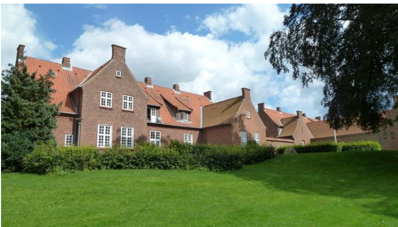
Hack Kampmanns bygninger set fra havesiden. Dommerbolig til venstre, arrest og tinghus til højre