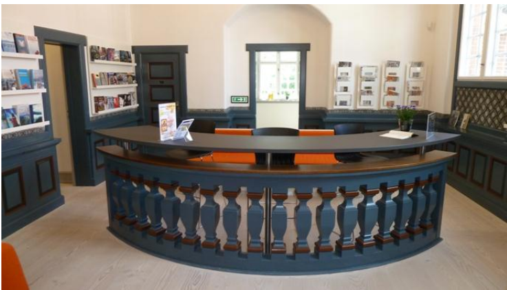
Den tidligere vidneskranke har fået ny anvendelse i biblioteket.