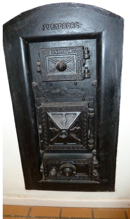
Til venstre madlem og kikhul til celle, til højre en kakkelovn. Hver celle var forsynet med kakkelovn, af rigtig Hack Kampmann-kvalitet, men fyringen foregik naturligvis udefra.