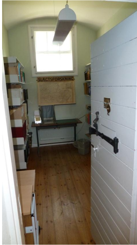
Til højre indgangen til arresten, nu egnsarkivet. Til venstre en celle, nu med egnsarkivets reoler