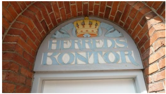
Eksempler på Hack Kampmanns udsmykninger over dørene