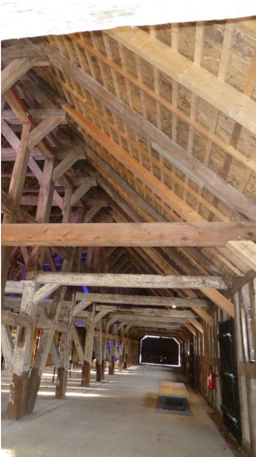
Figur 3. Karlsladen er en såkaldt "agerumslade" eller "kørelade", hvor vognene kunne køre ind ad den ene ende og ud ad den anden og læsse af til siden. Her ses "kørevejen" i laden. Udstillingen er i hovedrummet til højre.