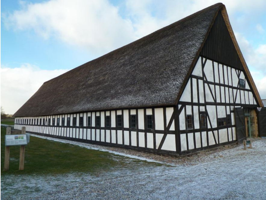
Figur 2. Karlsladen besøgscenter