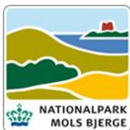
Figur 1. Nationalparkens logo, den røde plet i baggrunden er Kalø Slotsruin.

Begge besøgscentre er uden betjening og uopvarmet. Herunder billeder fra besøgscentret på Kalø, samt kort over Nationalpark Mols Bjerge.