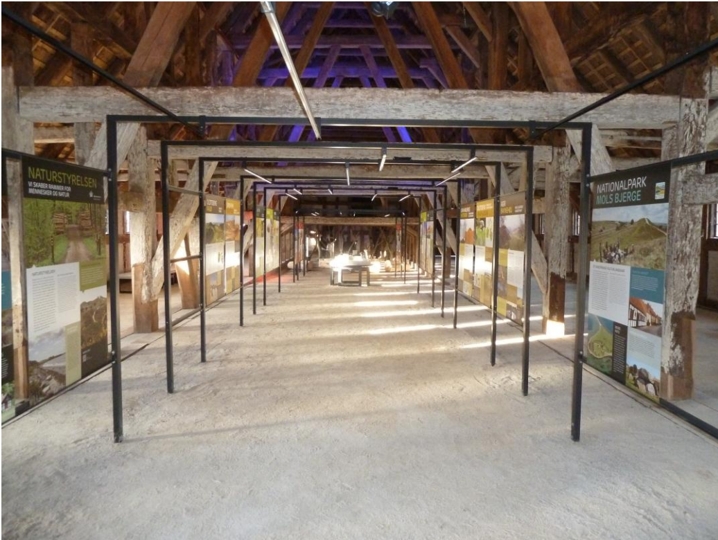
Figur 4. Hovedrummet med besøgscentrets udstilling. Plancher i forgrunden, model af slottet samt fortællehjørne i baggrunden.