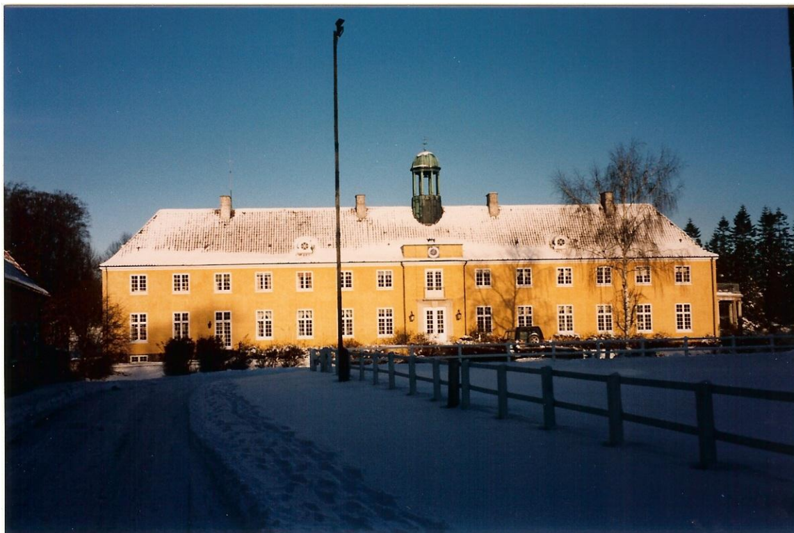
Møllerups hovedbygning, foto 1998. Ridebanen i forgrunden til højre, hestestalden til venstre. Uden for billedet, til højre, ligger den tidligere Hubertus-kro, der oprindeligt var bygget som studestald.